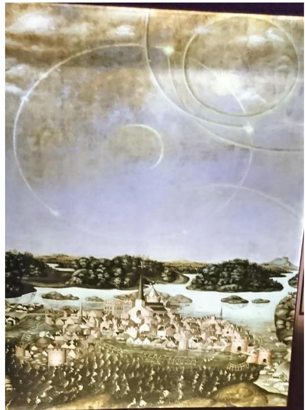
Den första kända bilden över Slussen

Den mycket omfattande arkeologiska undersökningen visar bl.a. att det funnits en planlagd bebyggelse på Södermalm som är mycket äldre än vad vi tidigare har trott. En generation efter att Stockholm grundades har vi en förstad, vilket är unikt för Sverige vid denna tid. Grävningarna är mycket intressanta för arkeologerna, som successivt gräver sig ned lager för lager för att nå orörda jordlager. Man har genom århundraden fortsatt bygga direkt ovanpå tidigare bebyggelse. På ett ställe har man grävt ned ca 10 meter från dagens marknivå och passerat ett antal s.k. kulturlager med fynd från olika tidsepoker. Det är flera intressanta och väl bevarade fynd som grävts fram. Man har bl.a. hittat sopor med bevarade dofter. Alla dessa fynd har lärt oss mer om hur folk levde och alltså även hur det kunde lukta på den tiden.